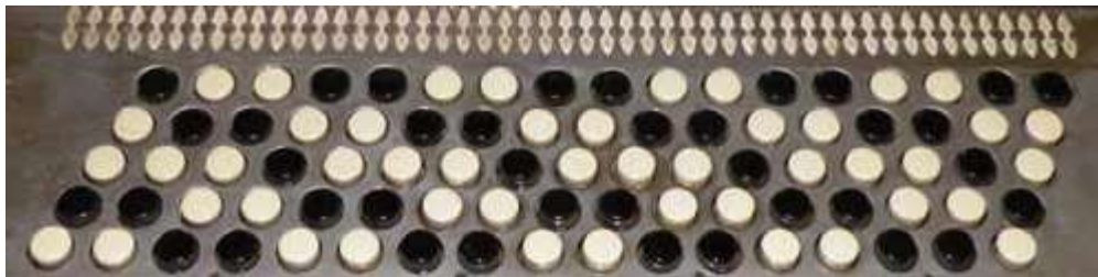
Bilden ovan visar slätklaviatur. Detta tillhör historien och är ingen som man skall spela på idag.

På ett pianodragspel är det viktigt att alla pianotangenterna ligger i samma nivå. Ingen tangent skall sticka upp över de andra. Beträffande tangenterna på ett knappdragspel är det viktigt att instrumentet har s.k. trappstegsklaviatur. Detta innebär att varje knapprad ligger i varsin nivå, med några millimeters skillnad. Även här gäller som vid pianoklaviatur att ingen knapp i samma rad, skall sticka upp högre än de andra. Det finns riktigt gamla dragspel med s.k. "slätklaviatur". Små knappar, som allesammans ligger i samma nivå, ofta sticker de ut ut en plåt. Den här typen av instrument hör till en förluten tid. Det är mycket svårt att använda tummen vid spel på slätklaviatur. Du skall absolut inte ha ett instrument med slätklaviatur.