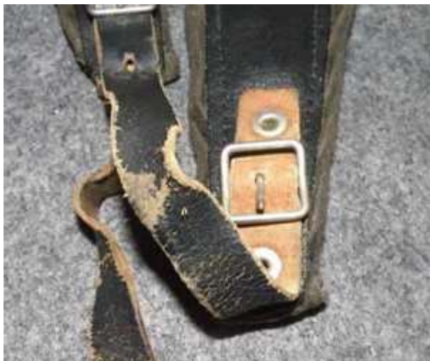
Exempel på hård sliten rem