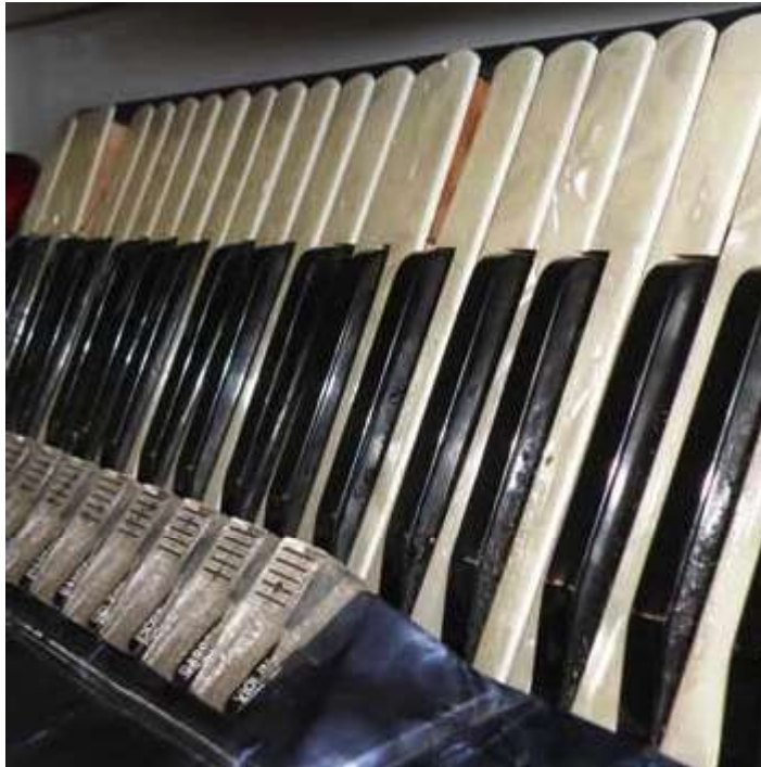
Exempel på pianoklaviatur där tangenterna inte ligger i samma nivå.