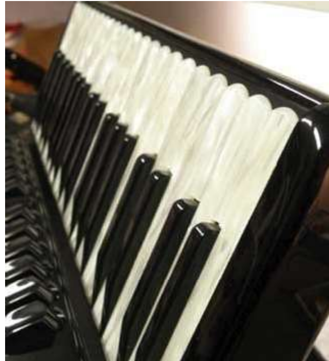
Perfekt justerad pianoklaviatur.