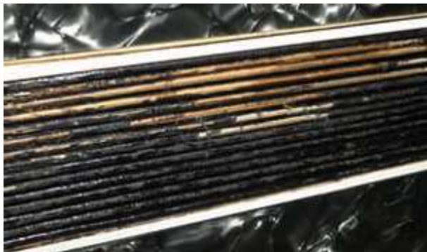
Bälg med stora förslitningsskador