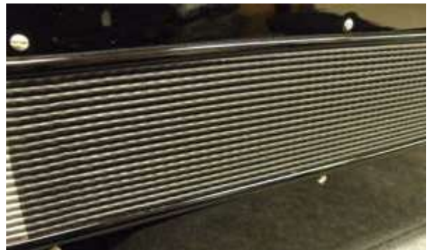
Ny bälg i perfekt skick